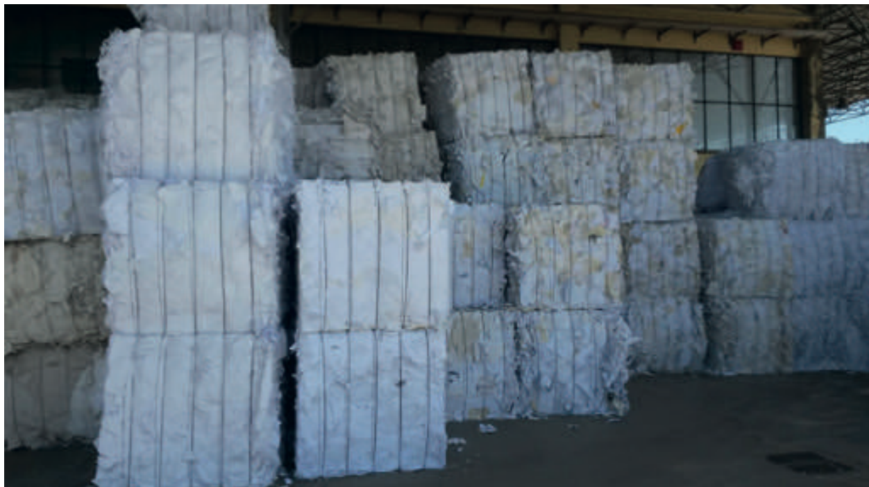
IL VALORE DELLA CARTA DA MACERO È TORNATO AI MINIMI STORICI COME NEL 2008

Per decenni le imprese hanno creato valore dal recupero dei materiali e questo stesso valore è stato distribuito nella filiera, fino al produttore del rifiuto, che si è visto riconoscere un corrispettivo economico per la cessione del rifiuto piuttosto che essere costretto a pagare, come avveniva per tutti gli altri scarti. Oggi però, proprio quando si parla tanto di economia circolare e le direttive europee finalmente ne tengono conto, si assiste a un tale deprezzamento dei materiali recuperabili che la gestione dei materiali cardine dell'economia circolare, ovvero la carta e (ma non solo) rappresenta un costo per tutti.