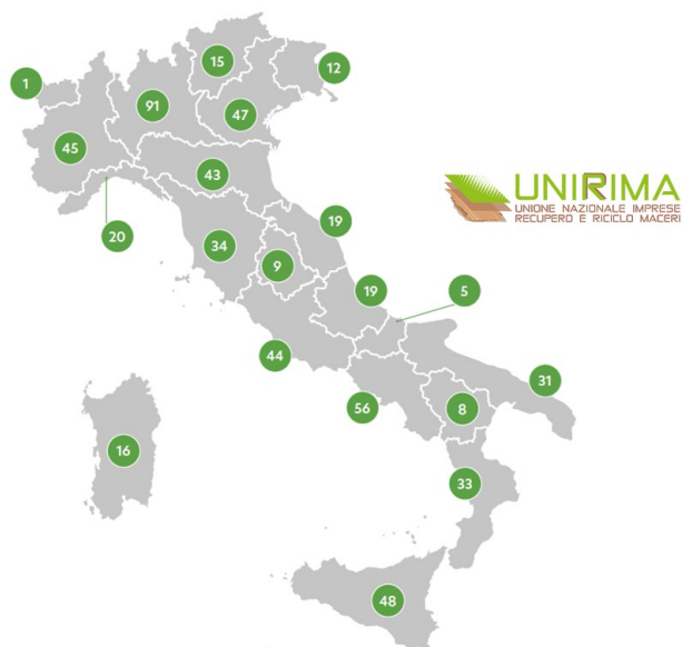
Localizzazione degli Impianti di Recupero/Riciclo carta e cartone per la produzione di Materia Prima - EoW

Il settore della carta da macero sta comunque attraversando, in questi ultimi anni, una fase di cambiamenti, sia sotto il profilo industriale che nelle dinamiche globali dei mercati delle commodities. Le sfide che si trova ad affrontare, sia a livello nazionale che internazionale, sono pertanto molteplici. Ne riportiamo alcune: